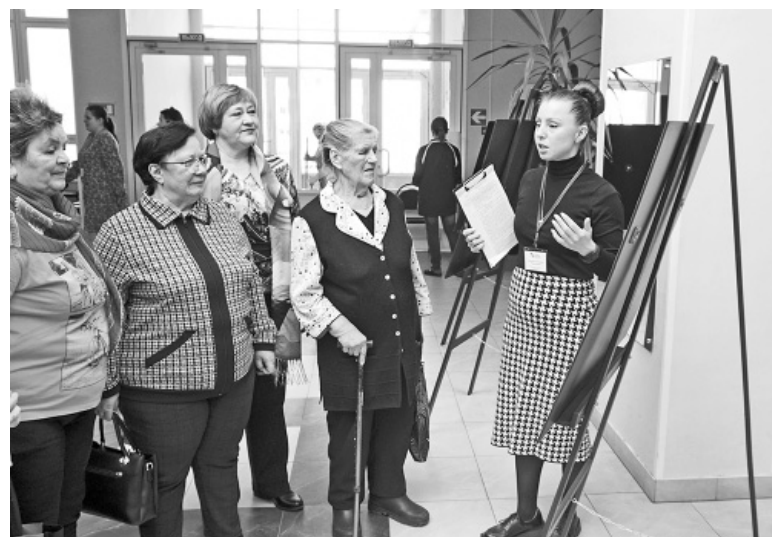
☞ На фестивале в Туношенской школе

Организаторами Фестиваля выступили Ярославское отделение банка России в партнерстве с Региональным центром финансовой грамотности населения, региональным отделением Социального фонда, межрайонной налоговой службой, региональным управлением Роспотребнадзора и Обществом по защите прав потребителей.