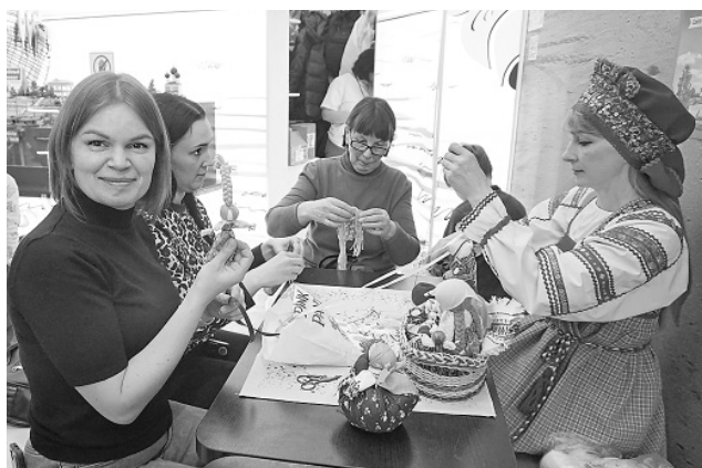
☐ Мастер-класс по изготовлению куклы Веснянки