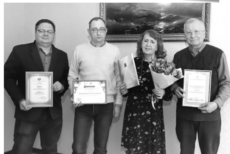
☞ Журналисты «Ярославского агрокурьера» с наградами