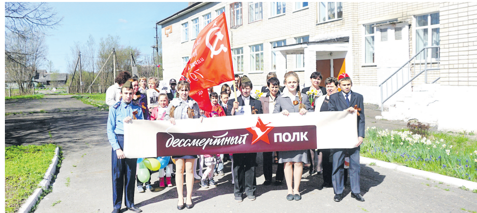
Акция «Бессмертный полк» в Ширинской школе, которой в этом году исполняется 145 лет