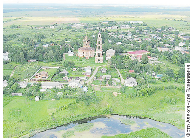
Курба с высоты птичьего полета

Люди хотят жить там, где создаются комфортные условия, выдвигают и поддерживают местные инициативы, направленные на развитие Курбского сельского поселения, чью красоту и самобытность важно сохранить для будущих поколений.