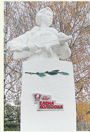
Она возглавляла группу девушек-партизанок, успешно